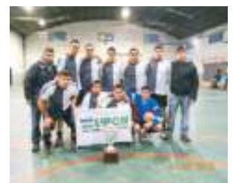
Equipo Los peores