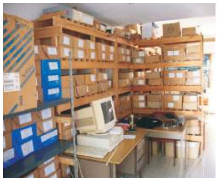
Archivos esperando ser exhibidos.