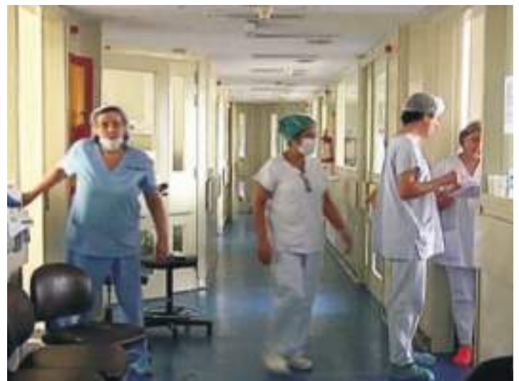
Enfermeros cuidados intensivos

La nota enviada remarca el atraso que se viene dando en el pago de los correspondientes retroactivos a los agentes públicos enmarcados en las leyes 1844 y 1904 que promocionaron automáticamente, pago que fue asumido en febrero pasado a través del Acta del Consejo Provincial de la Función Pública. También hace hincapié en que si bien se ve "el esfuerzo que debe realizar la Provincia para cancelar las deudas por este concepto que van de los 100 a los 5.000 pesos, no compartimos la modalidad de pago para aquellos trabajadores que superan los 5.000, siendo estos los más antiguos y esperanzados en llegar a las categorías superiores". La nota finaliza solicitando al gobernador "su intervención para considerar y modificar esta propuesta".