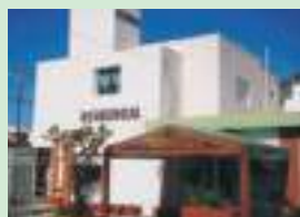
Residencial Rio-Mar en Viedma