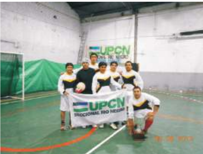
Equipo Esc. 255

Entre los objetivos de la organización se encuentra el de generar un espacio lúdico de esparcimiento para los trabajadores estatales. Las conclusiones señalan que generar eventos deportivos que incrementen el compañerismo entre personas que tienen intereses en común redundan en un mejor desempeño de las tareas laborales y en la mejora de las relaciones interhumanas e intrafamiliares.