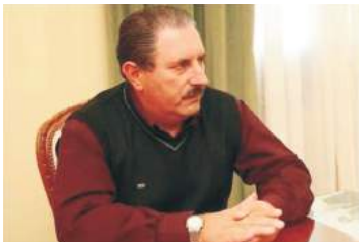
Secretario General UPCN

En el mes de mayo se retomaron las conversaciones entre UPCN y el Gobierno acerca del cumplimiento de la Ley 4640 que obliga al Estado a ‘ponerse al día’ con los aportes previsionales. La efectivización de esta ley -que en algún momento se intentó derogar- afecta directamente en la calidad de vida de los trabajadores en condiciones de jubilarse, que tendrán así la posibilidad de obtener un retiro en mejores condiciones remunerativas. Hasta que esta ley no se cumpla, las sumas ‘no remunerativas’ de los trabajadores del Poder Ejecutivo alcanzan en algunos casos hasta el 50% del monto de los salarios; en este sentido, gremio y gobierno conversaron sobre la reanudación del plan de regularización de aportes previsionales y el avance a posteriori de la jubilación de los trabajadores en condiciones de retirarse.