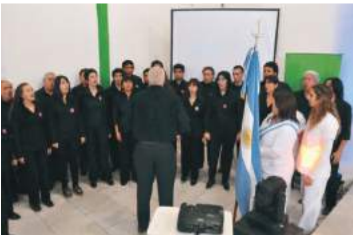
Coro en el acto de graduación de enfermeros en Viedma.