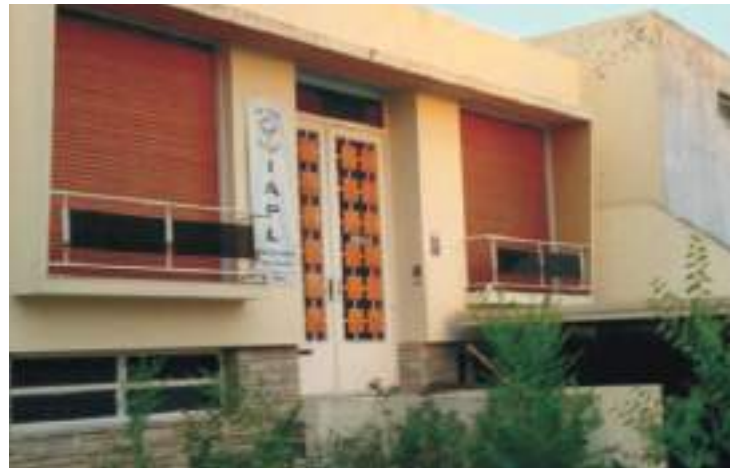
Instituto de Asistencia a Presos y Liberados Viedma

Entre los muchos puntos expuestos también figura la desintegración del equipo técnico del instituto de Viedma, donde la directora eliminó el espacio técnico semanal e impuso duplas y horarios de atención que ellos consideran intolerables; además dicen que nunca propuso conformar un equipo de trabajo ya que unilateralmente toma decisiones "ninguneando" al personal, limitando la comunicación y el contacto social, así como desprestigiando a una persona ante sus compañeros o desacreditando la capacidad profesional y laboral.