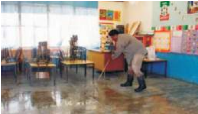
Trabajadores en su labor diaria

Actualmente, la UPCN está realizando gestiones en pos de obtener para el Personal de Servicios de Apoyo beneficios que favorezcan la igualdad de oportunidades de este grupo de trabajadores; en este sentido se gestionan períodos y reconocimiento de capacitaciones para el personal que realiza las funciones de cocinero y ayudante de cocina, solicitando al menos dos capacitaciones anuales para la zona atlántica; también se gestiona un aumento en el pago de las horas complementarias, cabe aclarar que actualmente se cobran diez pesos por tal concepto y lo solicitado ha sido un aumento que lleve la hora complementaria a un rango de veintidós a treinta pesos, lo que representaría un aumento aproximado del 100 % y un reconocimiento merecido por este grupo de trabajadores que tanto aporta al colectivo de educación. El gremio sigue trabajando en pos de la actualización de categorías a partir del mes de julio de 2013, compromiso que ya asumió el Ministerio de Educación provincial.