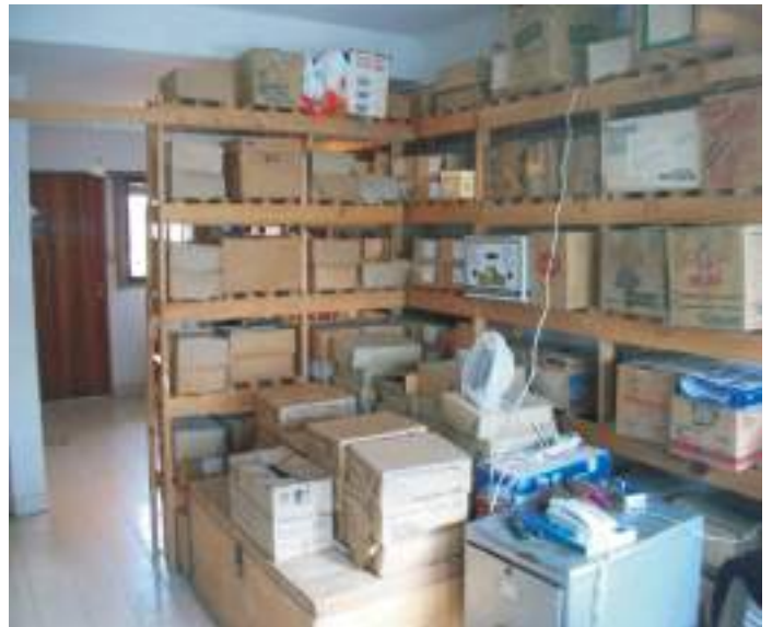
Interior del edificio

Centro de Estudios Rionegrinos y finalmente fue declarado Museo ya que posee una de las colecciones de material arqueológico más grande de la Provincia. En otros tiempos, contenía las salas de exposiciones antropológica e histórica en las que se exhibía su valioso material algunos cuya antigüedad se calcula en 10.000 años. Este museo también alberga una importante hemeroteca y biblioteca que llegó a constituirse en motivo de visita de alumnos, pensadores, historiadores y turistas, así como un espacio de encuentro de diversas actividades artísticas y culturales de las organizaciones de la comunidad viedmense.