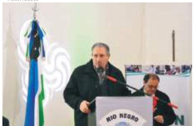
Secretario General UPCN