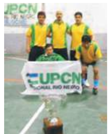
Equipo Moreno 601