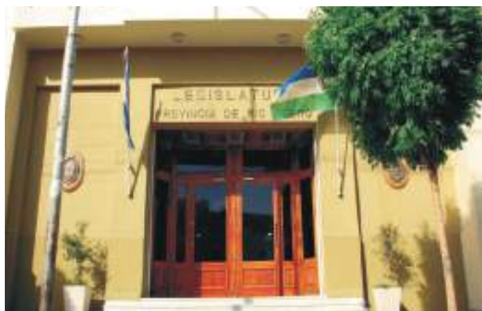
Legislatura de la Provincia de Río Negro

En el mes de junio, la UPCN presentó ante la Cámara de Trabajo de Viedma, una demanda judicial contra el Gobierno de la Provincia de Río Negro. En dicha demanda se reclamó la aplicación de la Ley 4640 con efecto retroactivo al 26 de abril de 2011, a todo el personal dependiente del Poder Ejecutivo Provincial que esté comprendido entre los 50 años (mujeres) y 55 (hombres). En la misma demanda también se reclamó la incorporación de todos los adicionales como sumas remunerativas sujetas a aportes. Previo a iniciar la acción judicial se hizo el correspondiente reclamo al Poder Ejecutivo y ante la falta de respuestas se realizó el reclamo por vía judicial.