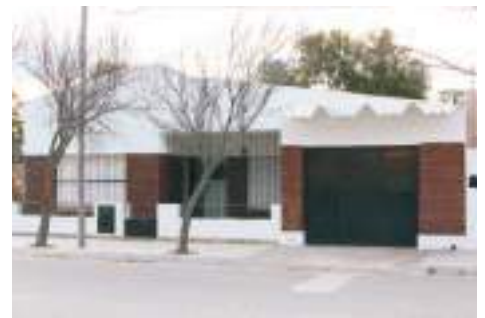
Sede en Río Colorado

Siguiendo atentos a la política de crecimiento y la favorable inversión del dinero aportado por nuestros afiliados, hemos adquirido dos viviendas para instalar las sedes de UPCN en las localidades de Río Colorado y Choele Choel. De esta manera, el gremio sigue incrementando su patrimonio inmobiliario en beneficio de sus afiliados ya que sumando estas propiedades se reducen los montos abonados en concepto de alquiler.