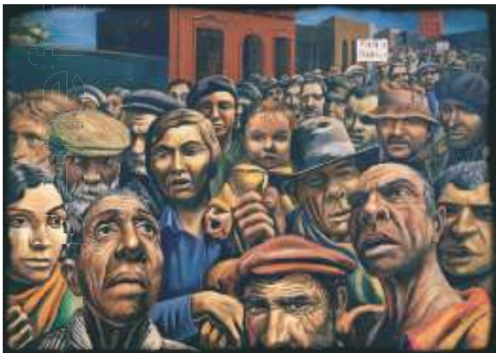
Antonio Berni "El pueblo" arte revolucionario

Durante la dictadura impuesta en 1976 el derecho colectivo quedó clausurado; se disolvió la central sindical (CGT); se intervinieron todos los sindicatos; se prohibió la huelga y la participación política. En este marco no existía la negociación colectiva y en los hechos se persiguió, encarceló y asesinó a todo dirigente o activista sospechado de retomar clandestinamente cualquier actividad sindical. Con la vuelta de la democracia la central sindical había sido restituida, en el año '84 se intenta eliminar la CGT única y el sindicato único a través del Congreso, el gobierno presenta un proyecto conocido como ‘Ley Mucci’ para promover la participación de las minorías en los gremios y prohibir la