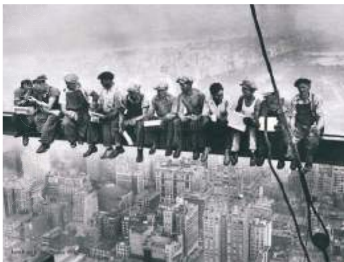
Obreros almorzando en una construcción siglo XX

El derecho del trabajo comienza a sistematizarse y a bosquejarse en Argentina como un corpus de normas luego de la huelga general de 1902, llevada adelante por los dirigentes anarquistas y reconocida como la de mayor dimensión hasta entonces en América Latina; en base a ello se redacta un anteproyecto de Ley de Contrato de Trabajo preparado por Joaquín V. González, que abre la puerta a un planteamiento diferente de las relaciones laborales y comienza a enmarcar el mapa en torno a conceptos relacionados con legislación industrial u obrera, nuevo derecho, derecho obrero o derecho social, que dan paso a