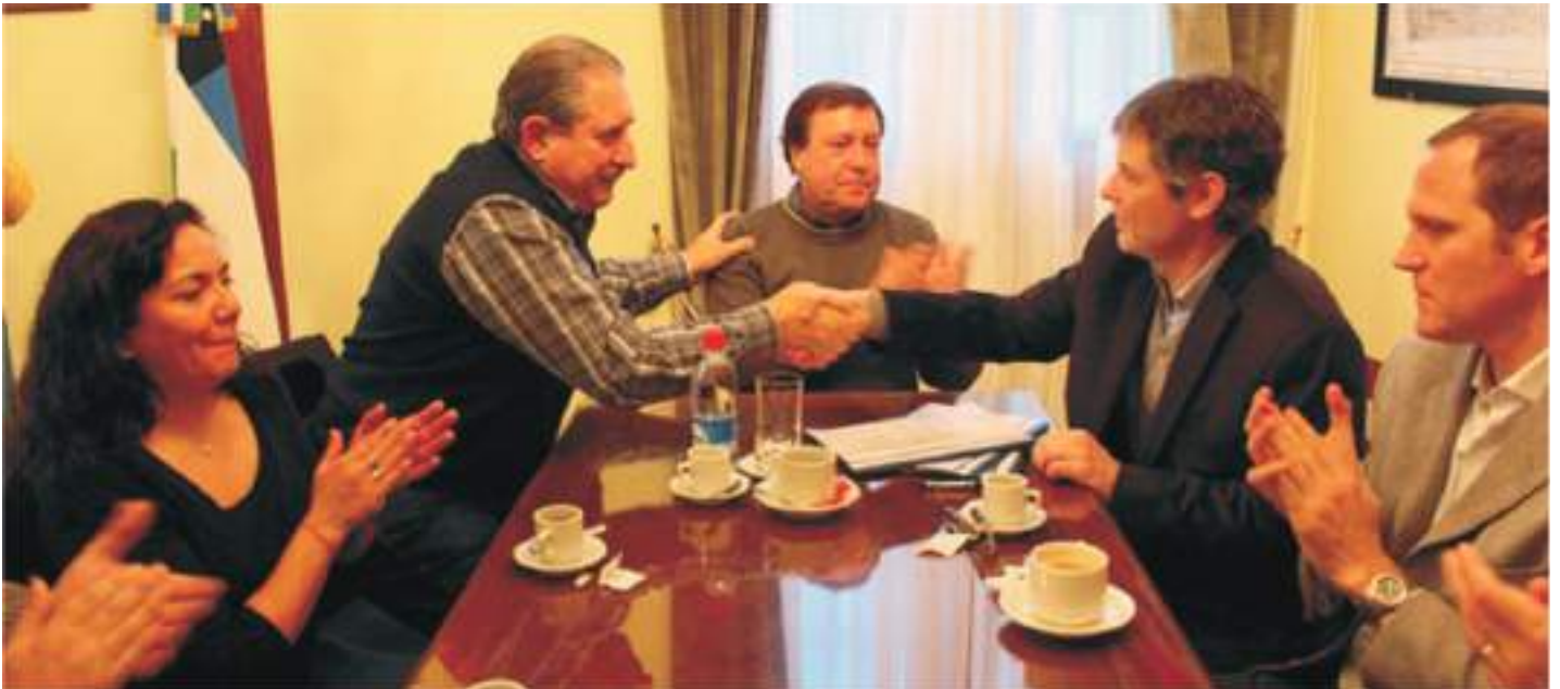
Momento del acuerdo

En julio se suscribió un convenio entre la Unión Personal Civil de la Nación y el IPPV tendiente a regular el traspaso de 124 empleados de Viviendas Rionegrinas Sociedad del Estado a distintas áreas de la cartera provincial.