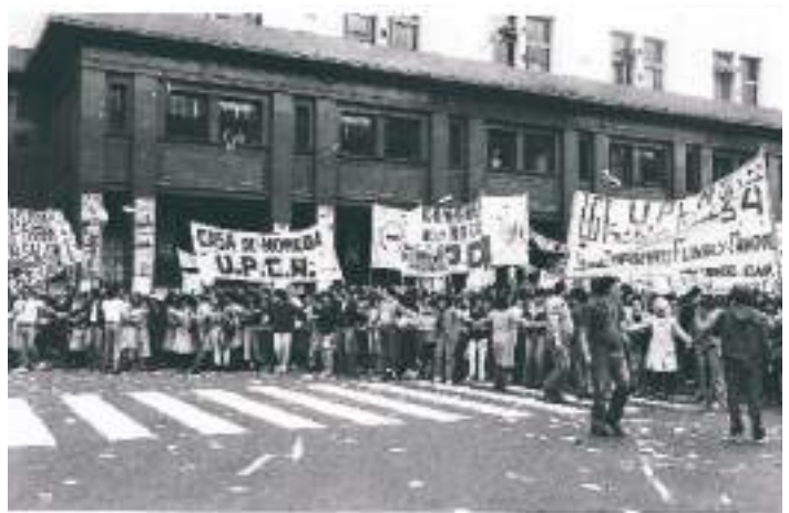
Luchas sindicales 1990

El momento más relevante de la Historia del Derecho del Trabajo en Argentina está relacionado con la gran transformación que se produce desde 1943 a 1955. Este periodo significó que en poco más de diez años se conquistaran los mayores logros en materia de derechos de los trabajadores. Un impulso preponderante lo marca la transformación del Departamento Nacional de Trabajo en Secretaría de Trabajo, encabezada por Juan Domingo Perón como titular del departamento; y más adelante, ya en el primer gobierno de Perón, dicha Secretaría se transforma por vía constitucional en el Ministerio de Trabajo y Previsión, siendo su primer Ministro Ramón Freyre. Por entonces se dictan importantes normas sobre el aguinaldo, las vacaciones, el aprendizaje, los descansos, la maternidad, las enfermedades, las indemnizaciones por cese motivado en la fuerza mayor, entre otras. También en ésta época salen las dos primeras normas sobre sindicatos, en 1943 y 1945, y la primera sobre negociación colectiva en 1953. Además, en 1947 por primera vez se genera en el fuero judicial un ámbito especializado en derechos laborales. También se incorporan por primera vez los asuntos relacionados con el trabajo a la Constitución de 1949; así, se introducen las normas sociales, que adjudican derechos a sujetos colectivos: la familia y los sindicatos. En 1955, la dictadura que derroca a Perón deja sin efecto la