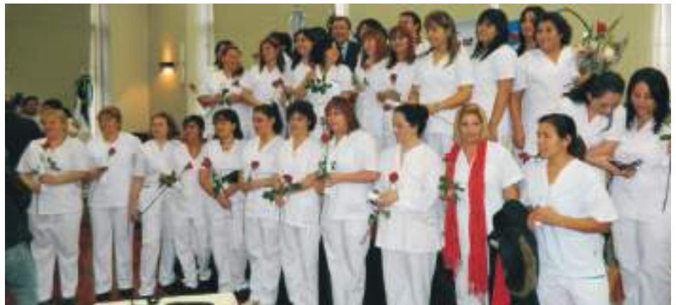
Egresados Bariloche 2013

La entrega de diplomas a los egresados de la Tecnicatura Superior en Enfermería se realizó en dos actos, uno en la ciudad de Bariloche y otro en la ciudad de Viedma.