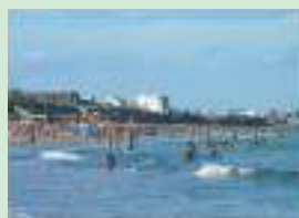
Balneario Las Grutas