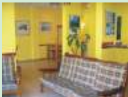
Hotel "Las Heras" en Mar del Plata