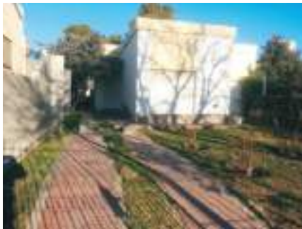
Sede en Choele Choel