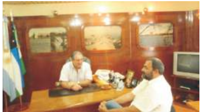
Secretario General de UPCN y Vicerrector de la UNRN.

pos de extender a la sociedad rionegrina, en este caso particularmente a los delegados sindicales de toda la provincia, un marco conceptual que otorga herramientas concretas para abordar un tema tan delicado como el de la violencia de género en el ámbito laboral.