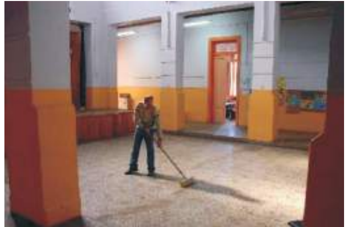
Personal en servicio

También obtuvieron el reconocimiento y pago de la indumentaria de trabajo -este año han sido quinientos pesos cobrados en tiempo y forma con el sueldo de marzo-, el cobro adicional para los trabajadores que cumplen la