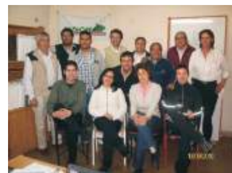
Compañeros Secretarios y Delegados de los distintos sectores de la Administración Pública Provincial y Municipal de Cinco Saltos.

Compañeras y compañeros del sector de Servicio de Apoyo de Educación de Cinco Saltos, movilizados hacia la Consejería de Educación en reclamo de sus justas reivindicaciones.