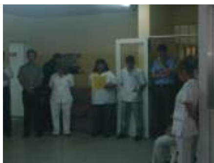
Acto por el día de la enfermera en el hospital de Cinco Saltos.