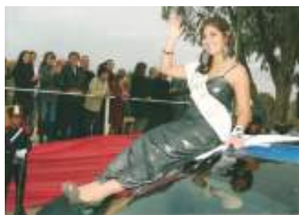
Reina rep. de Huergo